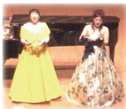
昨年度の公演風景