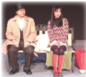
昨年度の公演風景