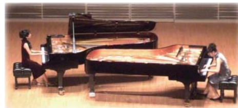
昨年度の公演風景