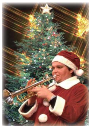
レオニド・コルキン