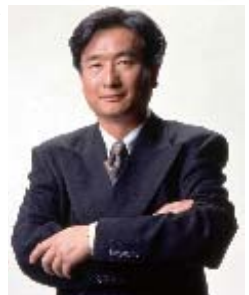
総合プロデューサー：三枝成彰

来年、平成21年に開催する文化イベント、「震災フェニックス」のプレイベントを開催します。陸上自衛隊の演奏や、市民が歌う“第九”などをお楽しみください。