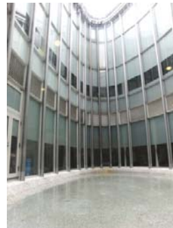
池から見上げた様子

グリーンルームのある1Fエリアは、光と水を取り込んで森を育てる「土壌」のイメージなのかもしれません。