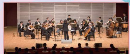
管弦楽 東京フィルハーモニー交響楽団(特別編成)