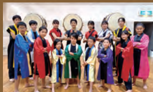
悠久太鼓 長岡光悠会