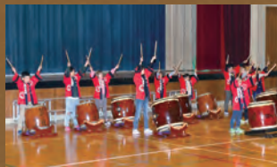
山古志小学校 太鼓クラブ