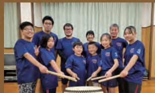
三島かたくり太鼓